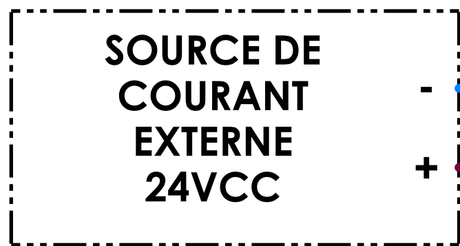
SCHÉMA DE BRANCHEMENT